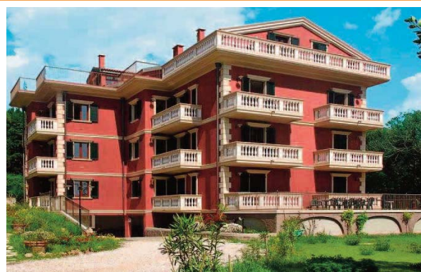
Villa Casa Marina

Pier Paolo Pasolini CENTRO DI LINGUA E CULTURA ITALIANA