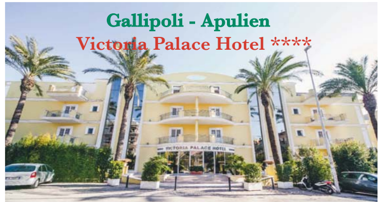
Gallipoli - Apulien Victoria Palace Hotel ****

Neben den Sprachkursen in Castiglioncello veranstalten wir im Juni und September einwöchige Italienischkurse in der wunderschönen Hafenstadt Gallipoli. Die Sprachkurse und Unterkunft werden im luxuriösen 4-Sterne-Hotel Victoria Palace nur 150 Meter vom Meer entfernt stattfinden.